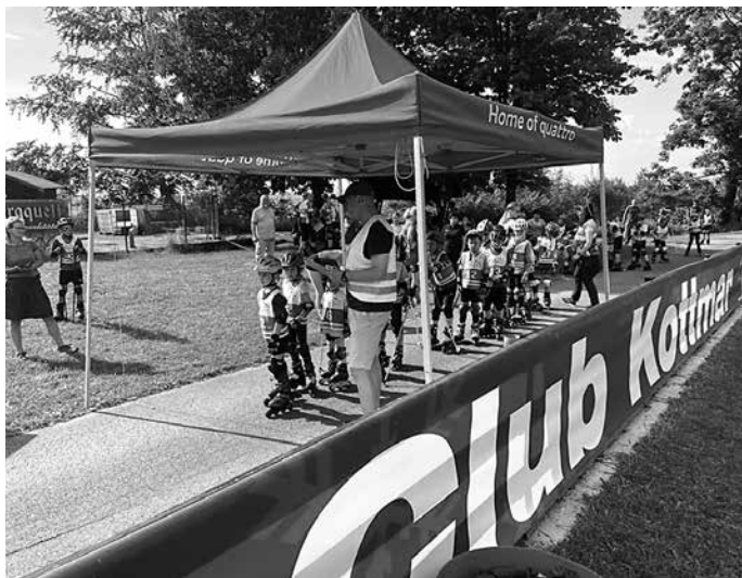
Als erstes durften die ganz kleinen auf die Strecke