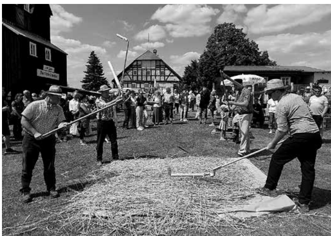
Die Kottmarsdorfer Flegeldrescher demonstrierten, wie früher Getreide gedroschen wurde, ehe es in die Mühle kam.

Und wie wurde das Geburtstagskind Mühle an seinem 180. Ehrentag außerdem bedacht? Da versetzten die Riesenseifenblasen aus der Blubberey von Michael Kubitz aus Eibau die Besucher in Feierstimmung. Viele, viele studierten das Innere der technischen Schauanlage, ließen sich zeigen, wie der Koloss aus mächtigen Holzbalken in die richtige Windrichtung gedreht wird, ließen auf der Dezimalwaage des Müllers ihr persönliches Gewicht bestimmen und bekamen dafür eine individuelle Wiegekarte. Die Flegeldrescher, die das für die Mühle bestimmte Getreide ausdroschen, erhielten für ihre Demonstrationen immer wieder Beifall.