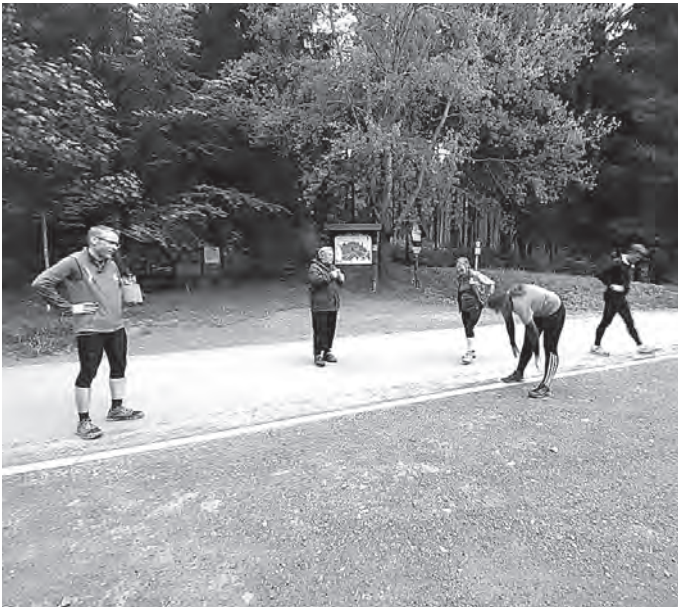
Dehnung mit Abstand – die TG Erwachsene

Während sich unsere Nachwuchssportler im Heimtraining auf hoffentlich ab Herbst wieder stattfindende Wettkämpfe vorbereiteten und einige erwachsene Mitglieder versuchten unter den schwierigen Bedingungen unser Ski Areal zu sichern und notwendige Arbeiten zu erledigen, mussten wir am 8. April und in der Nacht vom 24. zum 25. April Schäden durch Vandalismus verzeichnen. Einmal wurden Matten aus dem Aufsprunghang herausgerissen und beim zweiten Mal wurde versucht, eine Tür aufzubrechen. Diese wurde dabei erheblich beschädigt. Beide Male wurde Anzeige erstattet, aber das Schlimmste ist, dass zur Beseitigung der Schäden wieder viele Arbeitsstunden zusätzlich notwendig sind. Einige der dringend notwendigen Arbeiten konnten unter Ausnutzung der Ruhe im Skiheim von einigen fleißigen Helfern schon erledigt werden. So wurden von Familie Pinkert die Garderoben renoviert. Christian Schaller rekonstruierte unseren Ski-Club-Anhänger und rückte gemeinsam mit Volker Pallmer unserem Holzhaufen zu Leibe. Als nächstes wird die Zeit der Abwesenheit von Sportlern im Skiheim dazu genutzt, den Speiseraum zu renovieren. Nach den seit Anfang Mai erfolgten Lockerungen darf nun auch wieder im Freien unter Einhaltung der Hygienebestimmungen trainiert werden. Damit konnten zunächst wieder einige Sportler mit dem Training beginnen. Alle anderen folgen in den nächsten Wochen schrittweise.