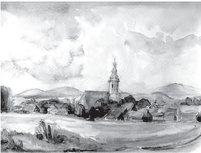
Eibau in den Lausitzer Bergen (Aquarell von Hans Seiler)

Der 100. Geburtstag ist nun Anlass, um mit einer Ausstellung an einen Künstler zu erinnern, der mit seinen gemalten oberlausitzer Landschaften den Menschen die Augen für die Schönheit unseres Landstriches geöffnet und damit indirekt zur Steigerung des Bekanntheitsgrades dieser Region beigetragen hat. Für einen Teil der Ausstellung mussten wir allerdings Fotokopien verwenden, da sich die Originale im Perleberger Museum befinden und ein Transport zur Zeit nicht möglich ist.