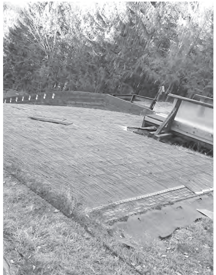
Herausgerissene Matten am Aufsprunghang

Als gäbe es nicht schon genug an Traurigkeit darüber, dass das Trainingsjahr nicht wie geplant beginnen konnte, gibt es auch noch Vandalen, die sich an den Sportanlagen unseres Ski-Clubs vergreifen und aus Übermut, Langer Weile und Zerstörungsdrang Schaden anrichten.